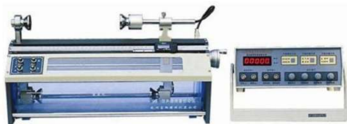
图 1: SV5 型声速测量仪

SV5 型声速测量仪（如图所示，主要部件包括信号源和声速测试仪（含水槽））、双踪示波器、不同长度的有机玻璃棒、不同长度的黄铜棒、游标卡尺等